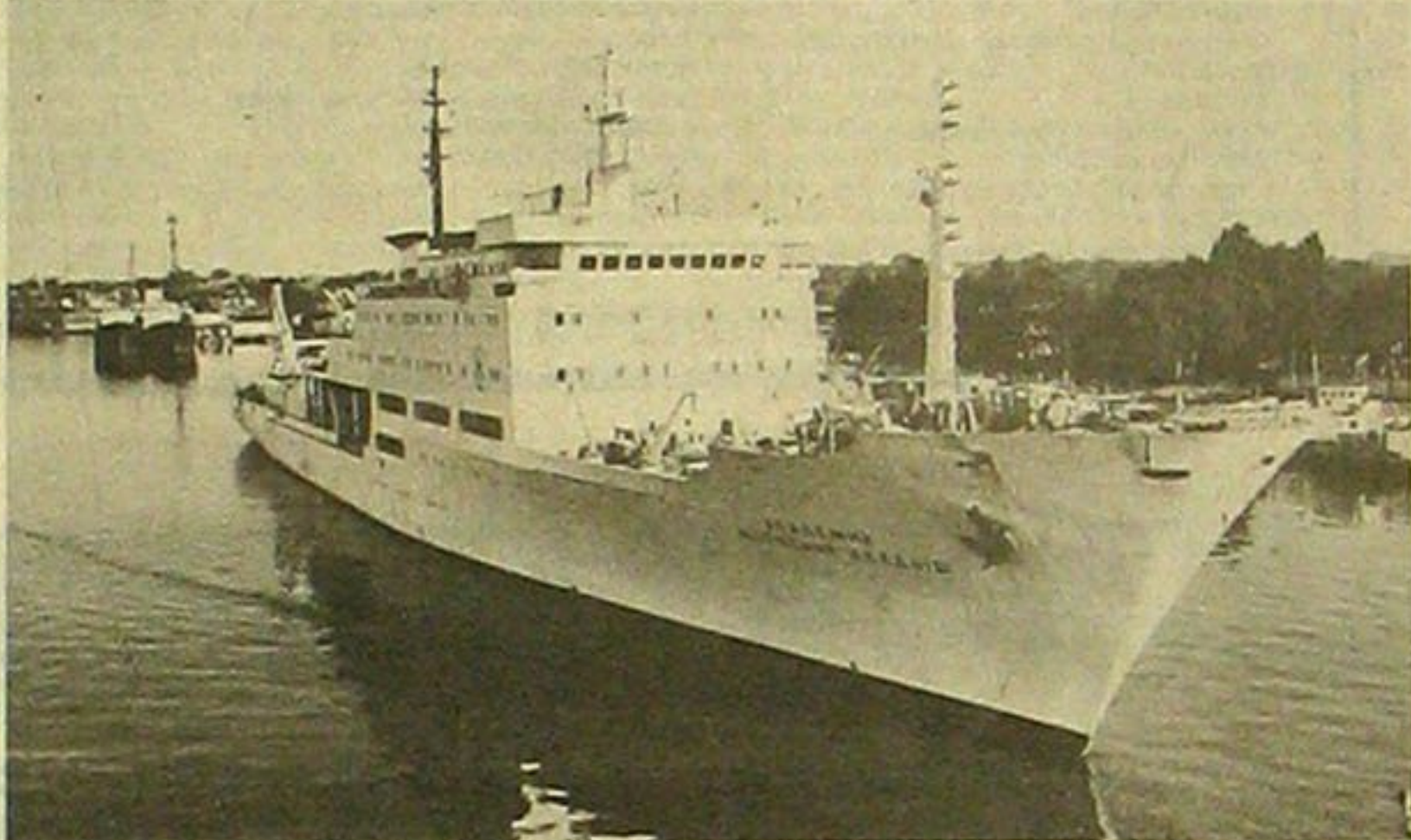
В Калининградский порт после 85-суточного рейса к месту гибели легендарного «Титаника» вернулся корабль науки «Академик Мстислав Келдыш»...