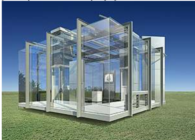
Projekt domu ze szkła australijskiego architekta

Dzisiaj również nie brakuje śmiałych architektonicznych projektów.